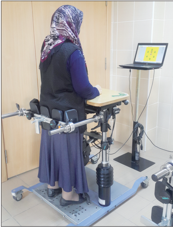
RESİM 1: Denge cihazı ile denge egzersiz uygulaması.

celeyen beş alt ölçekten oluşmaktadır. QUALEFFO'nun Türkçe versiyonu Koçyiğit ve ark. tarafından hazırlanmış, testin güvenilirlik ve geçerlilik çalışması yapılmıştır. 10